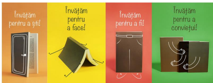
Educația pentru Dezvoltarea Durabilă

Conform UNESCO, educația pentru Dezvoltare Durabilă reprezintă „un instrument cheie pentru realizarea ODD-urilor (Obiectivelor pentru Dezvoltare Durabilă)”. Dezvoltarea Durabilă reprezintă o paradigmă bazată pe etică și educație pentru Dezvoltare Durabilă și are ca scop dezvoltarea competențelor care ajută indivizii să reflecteze la propriile lor acțiuni, ținând seama de impacturile lor actuale și viitoare, sociale, culturale, economice și de mediu. Această educație trebuie să devină parte integrantă a calității educației, inerentă conceptului învățării continue.